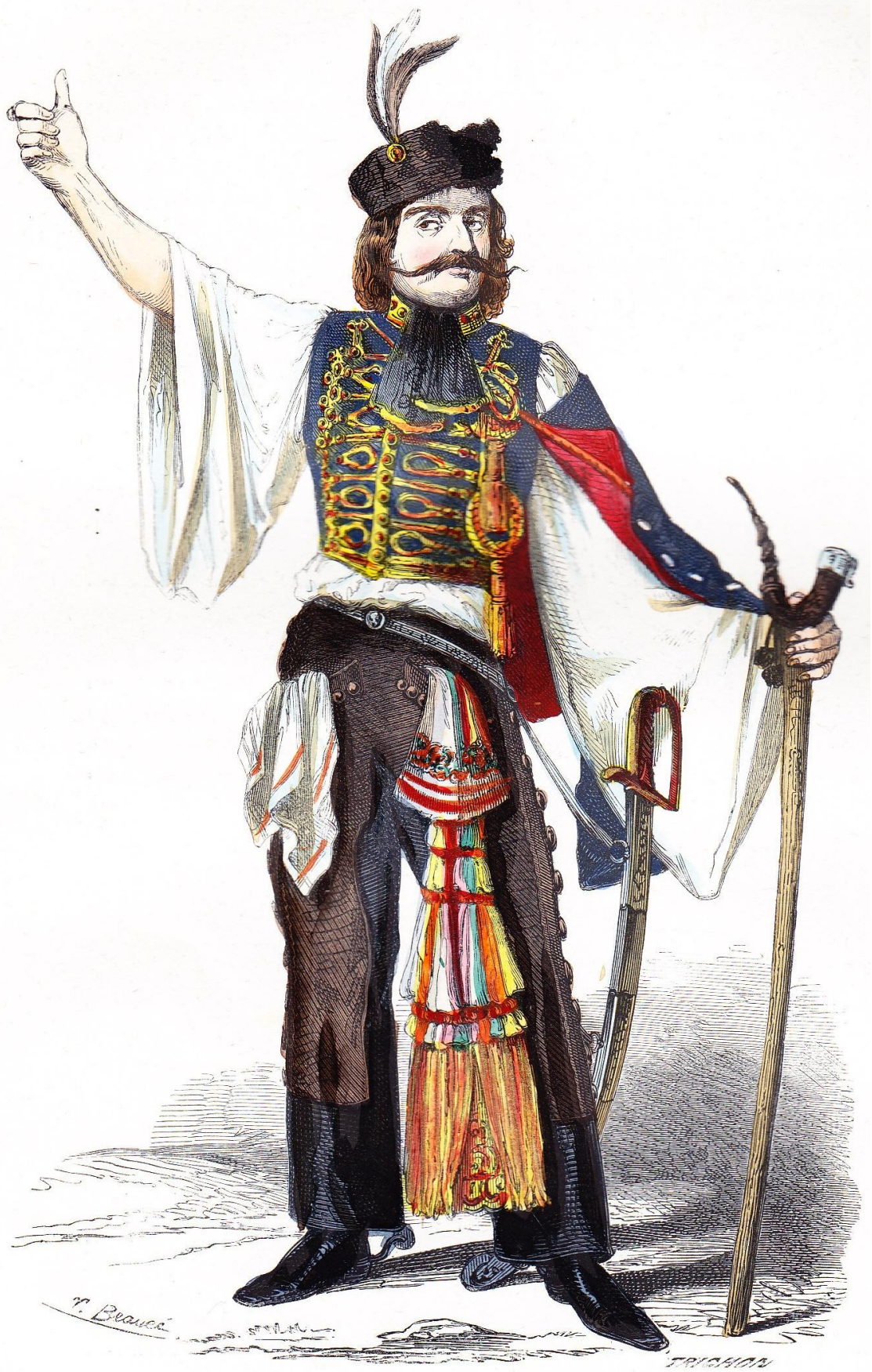
KORTES, OU CHEF DES ÉLECTEURS CAMPAGNARDS.